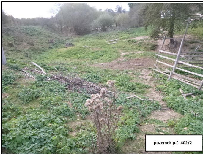
pozemek p.č. 402/2