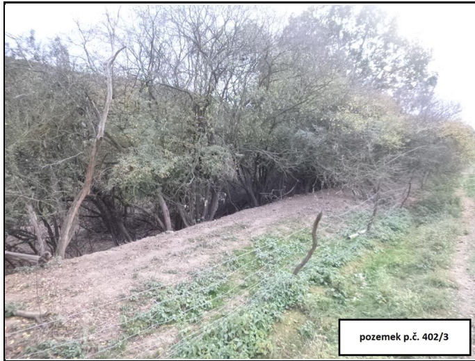
pozemek p.č. 402/3