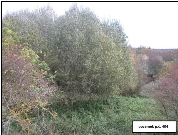
pozemek p.č. 404