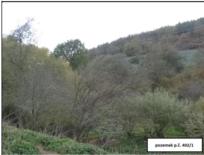
pozemek p.č. 402/1