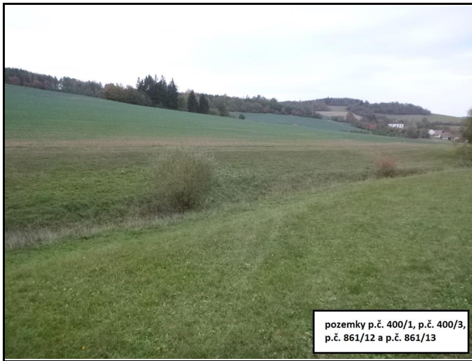
pozemky p.č. 400/1, p.č. 400/3, p.č. 861/12 a p.č. 861/13