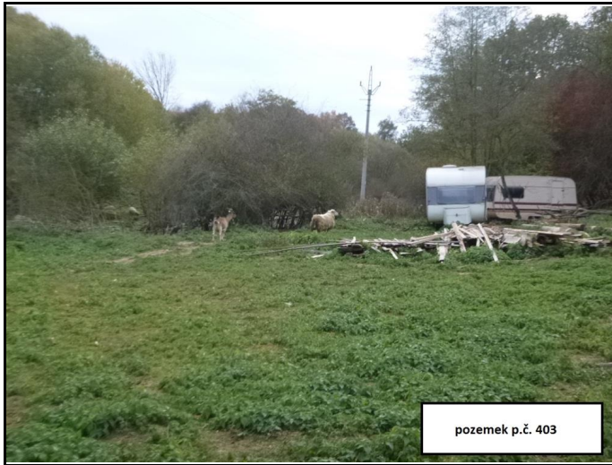
pozemek p.č. 403