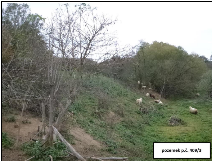
pozemek p.č. 409/3